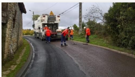
Validation technique in-situ réalisée en octobre 2017