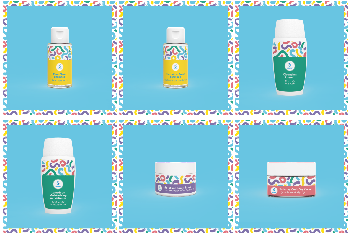
Solvays herstellende routine voor getextureerd haar