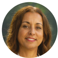
Ilham Kadri CEO de Solvay

Le Fonds de solidarité Solvay est vraiment l'un de nos plus grands atouts et il continue à changer des vies. Nous restons concentrés sur l'objectif premier du Fonds - aider les personnes à faire face aux difficultés pendant la pandémie de Covid-19 - mais son champ d'application s'est élargi pour inclure le maintien de l'éducation, le soutien aux personnes lors de catastrophes naturelles (telles que les inondations dévastatrices qui ont frappé nos communautés en 2021), et d'autres formes de difficultés exceptionnelles.