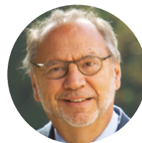
Peter Piot Président honoraire

En tant que représentant de la Fondation au sein du comité de gestion, je suis heureux de participer à la stratégie et de veiller à ce que les dons soient dépensés conformément aux objectifs du Fonds et dans le respect de l'intérêt public.