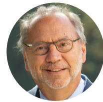
Peter Piot Erevoorzitter

Dit fonds belichaamt wat we zijn bij Solvay: voor elkaar zorgen, de last op de schouders van onze medewerkers verlichten, hen in staat stellen zich op de essentiële te concentreren en hun redenen geven om trots te zijn dat ze tot deze één gemeenschap behoren.