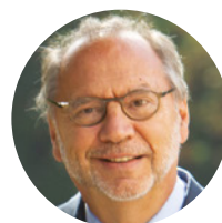
Peter Piot Erevoorzitter

Als vertegenwoordiger van de KBS in het directiecomité lever ik een bijdrage aan de strategie en zie ik erop toe dat de donaties volgens de doelstellingen en in overeenstemming met het algemeen belang worden besteed.