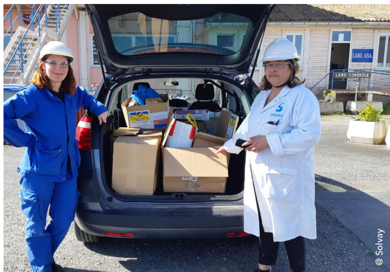
Employées de France

Inspirés par cette activité, les employés lyonnais, en France, ont également participé à l'initiative en collectant de l'aide vitale qui a été acheminée sur le site polonais.