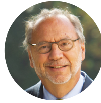
Peter Piot Président honoraire

En 2020, lorsque Solvay a demandé à la Fondation de gérer le Fonds de Solidarité Solvay pour venir en aide aux personnes en détresse, nous n'avons pas hésité une seconde.