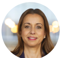
Ilham Kadri CEO de Solvay