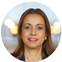
Ilham Kadri CEO van Solvay