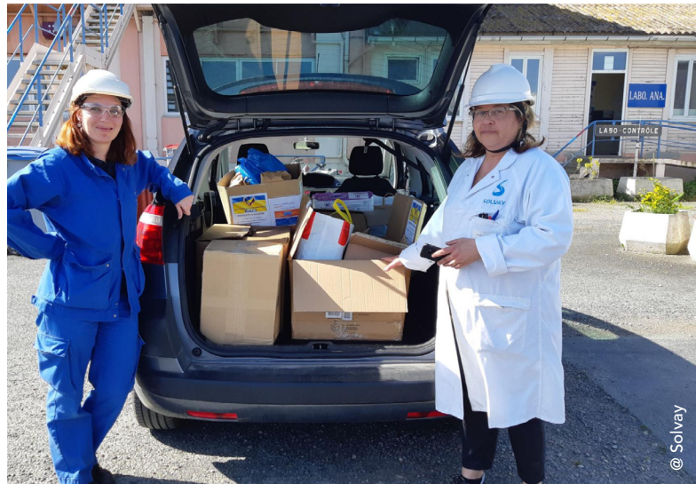
Employees from France

Die actie inspireerde ook de werknemers in Lyon (Frankrijk) om mee te doen en essentiële hulpgoederen in te zamelen , die naar de vestiging in Polen werden gebracht.