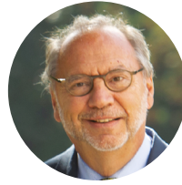
Peter Piot Erevoorzitter

Toen Solvay de Stichting in 2020 vroeg om het Solidariteitsfonds van Solvay te beheren, dat was ontstaan uit de vrijgevigheid van aandeelhouders, het bedrijf en het management om mensen in nood te helpen in ongekende omstandigheden als gevolg van de pandemie, hebben we geen moment gearzeld.