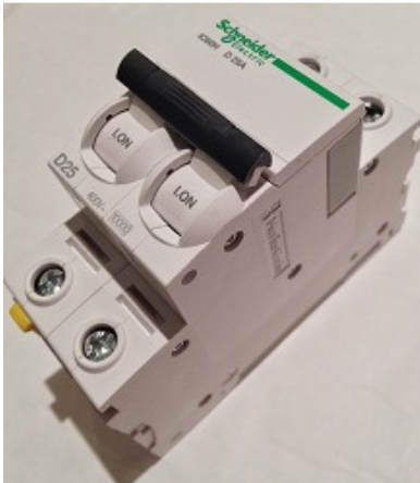
Technyl® One – Une technologie innovante pour les dispositifs de gestion de l'énergie.